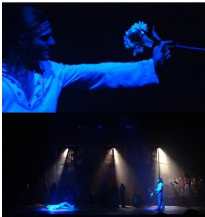
Figura 3 – Claude se encontra.