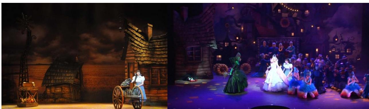
Figura 1 – A transformação da cena, do tom sépia no Kansas para o multicolorido de Oz.