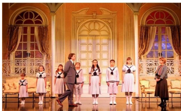
Figura 2 – A altura das crianças sugere a formação da escala musical.