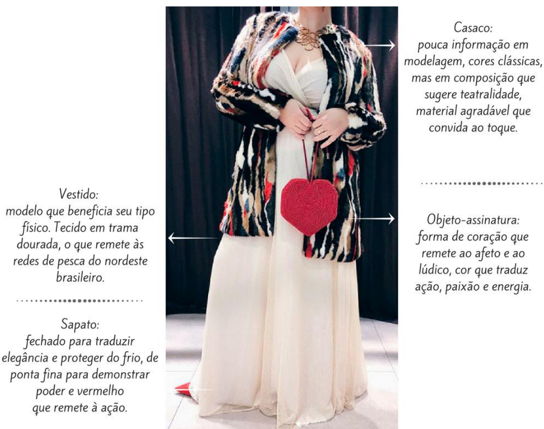
Figura 2: Acervo Pessoal

branco, preto, castor e vermelho) tidos como clássicos e tradicionais, além de serem os que ela tem preferência e privilegia em sua rotina, por serem os que mais a favorecem, segundo a análise de coloração pessoal realizada no primeiro momento da consultoria da cliente. O material agradável transmite uma sensação de aconchego e convida ao toque e à proximidade.