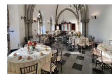
Brunch na Catedral

O evento Brunch na Catedral (realizado na Catedral da Sé), o Bar do Cofre (localizado no Farol Santander, antigo BANESPA) e a Casa de Francisca (localizada no Palacete Teresa) contribuem para a manutenção dos respectivos edifícios históricos. Somente o evento Brunch na Catedral contribui para a inclusão social ao destinar recurso para uma organização que atua diretamente na ajuda às pessoas em situação de vulnerabilidade social, a Missão Belém. O boteco Salve Jorge foi o único local estudado que tem como principal público os trabalhadores da região em horário de almoço e happy-hour durante a semana; os outros estabelecimentos atraem pessoas de outros bairros e até cidades em busca de uma experiência diferenciada e não permanecem no bairro.