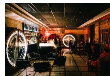
Bar do Cofre

As pesquisas foram estruturadas como estudo de caso único com visita técnica ao estabelecimento com aplicação de questionário. Os locais de estudo foram os das imagens ao lado.