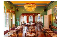
Casa de Francisca